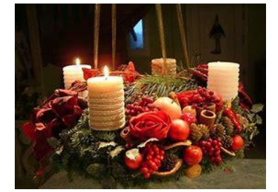
Seconde semaine de l'Avent